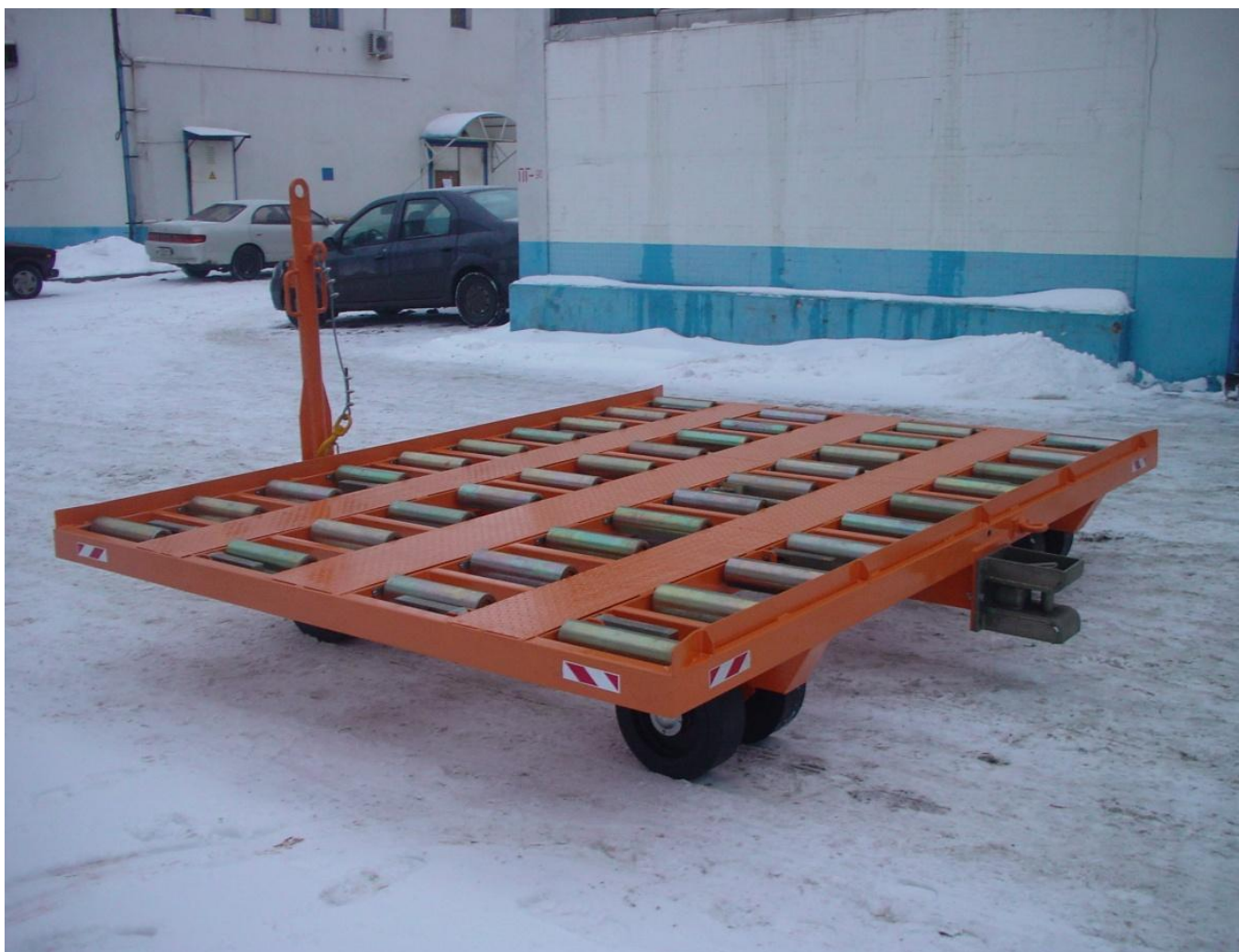
Фото тележки ТК-1500-073М