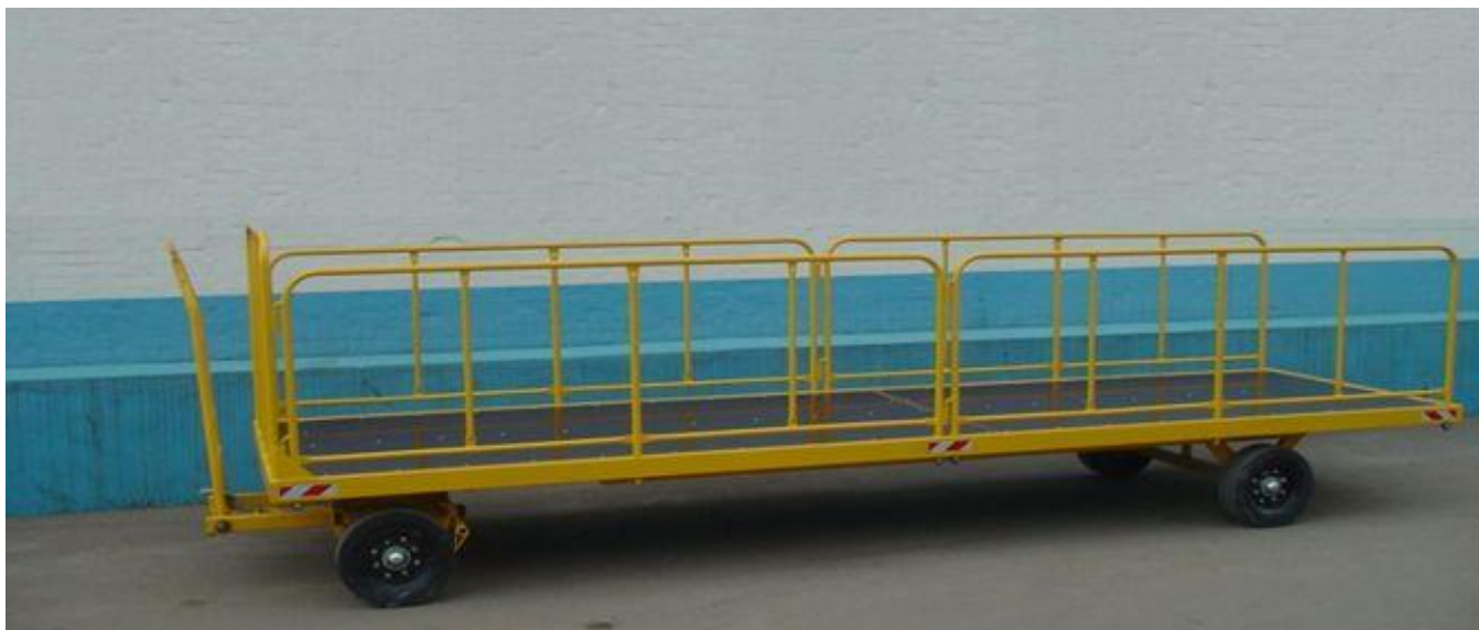
Фото тележки багажной ТГ-1500-09

Поворотное устройство обеспечивает поворот передних колѐс на 90° в обе стороны