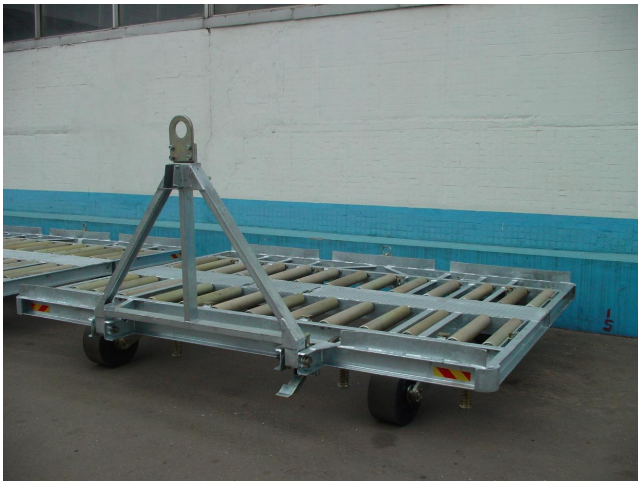
Фото тележки ТК-1500-07