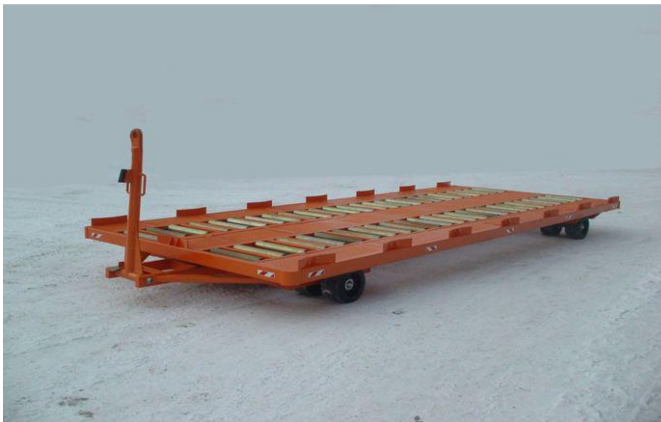
Фото тележки ТК-1500-20Р