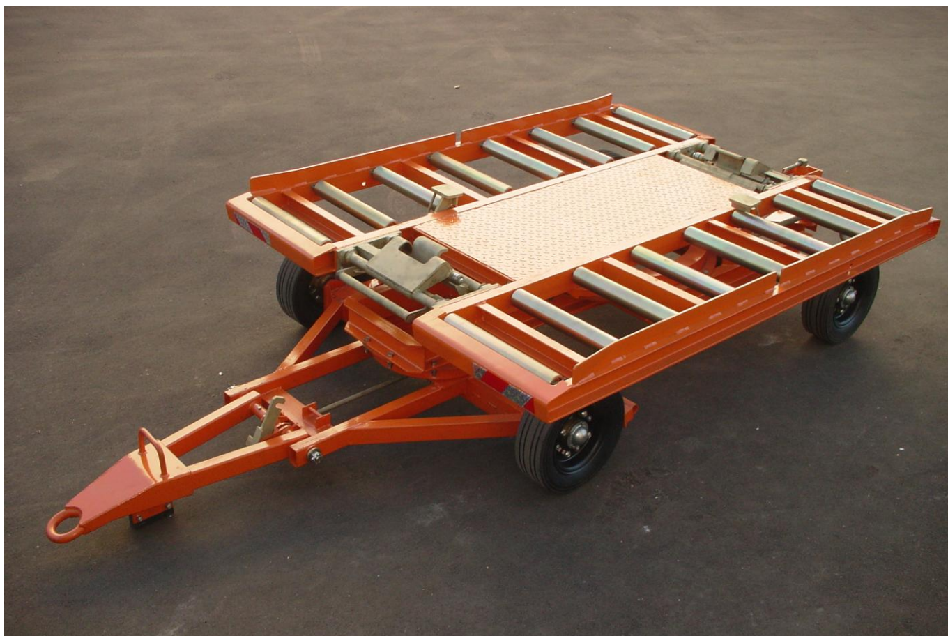
Фото тележки ТК-1500МА