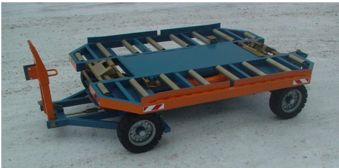
Фото тележки ТК-1500МА

оригинальные, разработаны и изготовлены ЗАО «Универсал-Аэро», имеет маслёрки для смазки